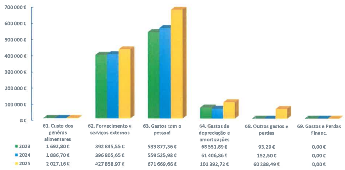
Gráfico 2 - Estrutura de Custos 2023 – 2024 - 2025

Em termos de representação de valores teremos o seguinte quadro: